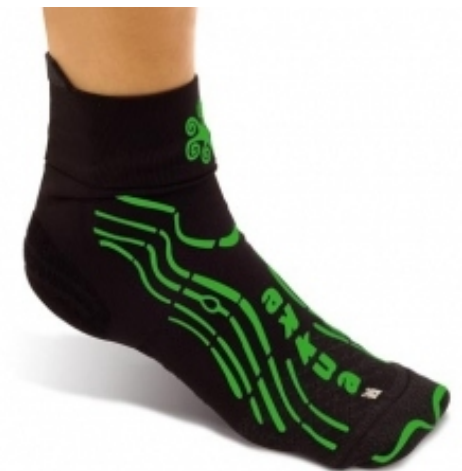
Rehab Piscina Classic

Tallas disponibles: S (34-37) • M (38-41) • L (42-45)