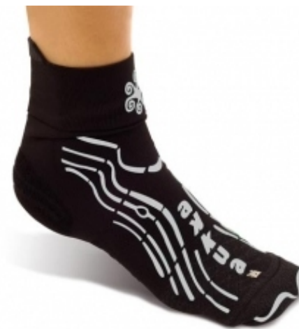
Rehab Gym Classic

Tallas disponibles: S (34-37) • M (38-41) • L (42-45)